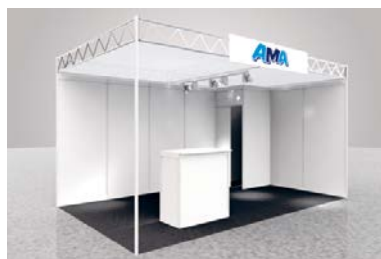
Modul «COMFORT», CHF 118.–/m 2

mindestens 9 m 2 Wandelemente Dünnspon weiss, Bauhöhe 250 cm Plattenteppich rot, blau, grau, anthrazit nach Wahl Gitterträger Chrom, UK 250 cm, OK 275 cm Blendentafel weiss 200 x 40 cm, inkl. Beschriftung (max. 20 Buchstaben) Beleuchtung LED-Spot weiss 25 W, pro 3 m 2 Standfläche 1 Stück Transport, Montage, Demontage exkl. Standfläche