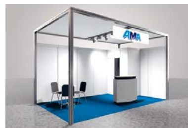
Modul «PRESTIGE», CHF 168.–/m 2

mindestens 12 m 2 Wandelemente Dünnspon weiss, Bauhöhe 250 cm Plattenteppich rot, blau, grau, anthrazit nach Wahl Gitterträger Chrom, UK 250 cm, OK 275 cm Blendentafel weiss 200 x 40 cm, mit Ihrem Logo Decke Stoff weiss Beleuchtung LED-Spot weiss 25 W, pro 3 m 2 Standfläche 1 Stück Kabine 1 m 2 , mit Falttüre abschliessbar Theke weiss, 103 x 53 cm, Höhe 110 cm, 1 Stück Transport, Montage, Demontage exkl. Standfläche