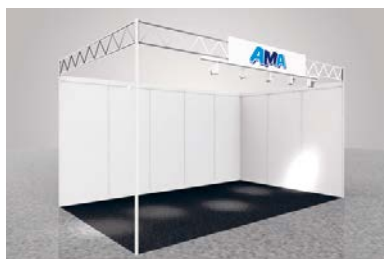
Modul «BASIC», CHF 68.–/m 2

Im Webshop kann ein Modulstand in der Grösse der Standfläche gemietet werden. Detaillierte Infos über die Möglichkeiten und Preise sind unten aufgeführt. Es ist möglich, dass die Abbildungen nicht in allen Details dem Original entsprechen. Sie erhalten in jedem Fall einen auf Sie zugeschnittenen Standplan. Der Preis versteht sich exkl. MwSt., Standfläche, Eintragungsgebühr, Strom und weiterer Nebenleistungen.